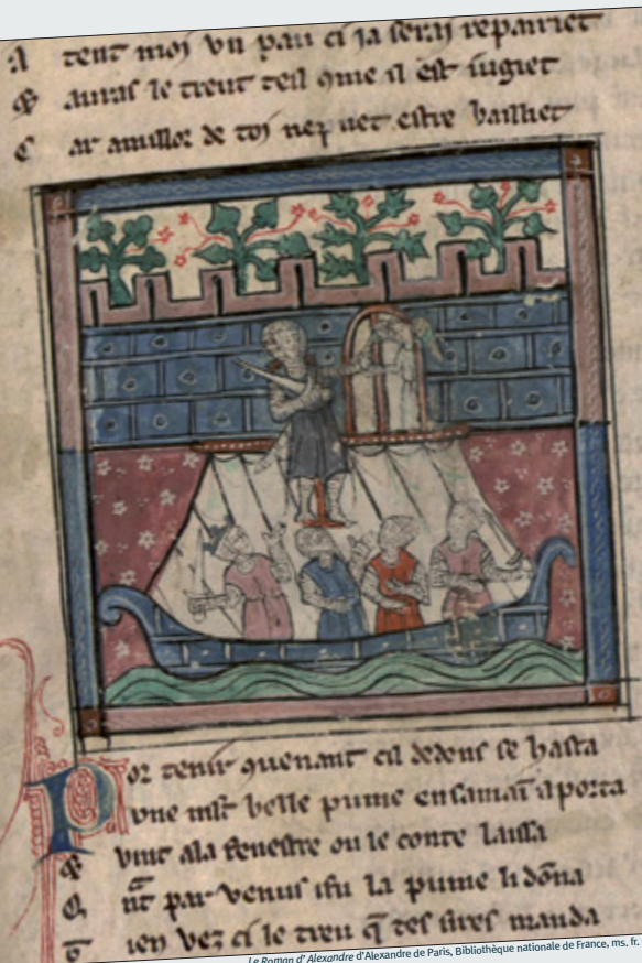
Le Roman d'Alexandre d'Alexandre de Paris, Bibliothèque nationale de France, ms. fr. 792, fol. 137

Conception et réalisation: service communication MESHs - Impression: université Lille 3